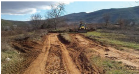
Caterpillar trabalhando na nova estrada entre o Centro de Mediugórie e a Colina das Aparições, onde surgirão calçadas pavimentadas e estrada asfaltada.